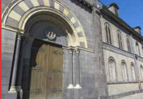
Chapelle du couvent de La Bade, Riom.